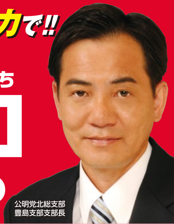
公明党北総支部 豊島支部支部長