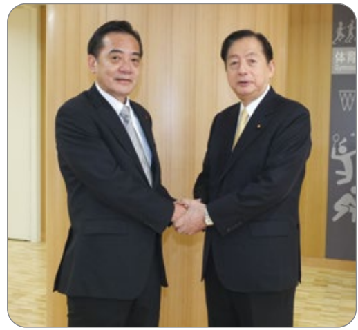
坂口かつや区議(左)に期待を寄せる 太田前国土交通大臣