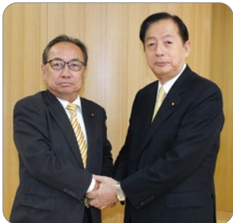
近藤みのり区議 左 に期待を寄せる 太田昭宏衆議院議員