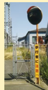
袋トンネルに 交通安全標識の設置