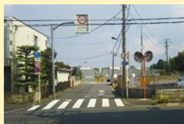
赤羽北3丁目にカーブミラーを設置