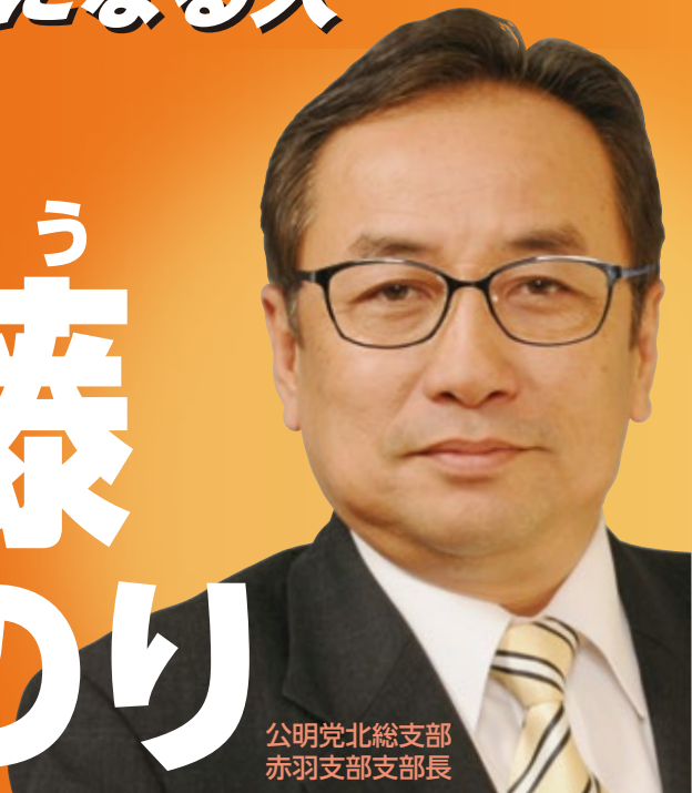
公明党北総支部 赤羽支部支部長