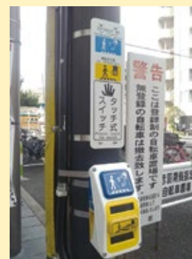
赤羽南に視覚障がい者用 音声信号機の設置